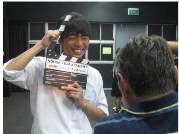
アカデミー監督による撮影・・・